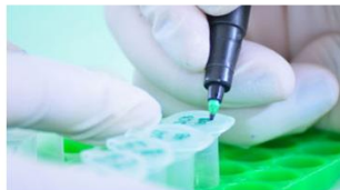
Pharma - Chimie - Medtech - Biotech