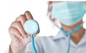
Santé - Social - Services