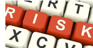
Gestion des risques