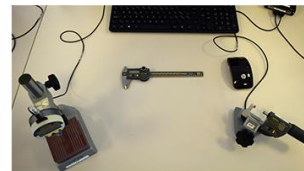
Qualité en laboratoire (métrologie)