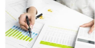
Qualité: système, audits, outils