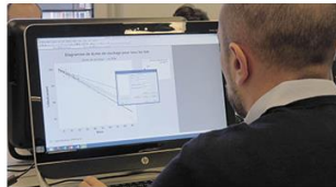
Mesure & analyse des données